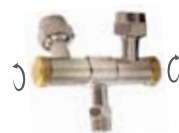
Incluye 16 portaboquillas articulados doble